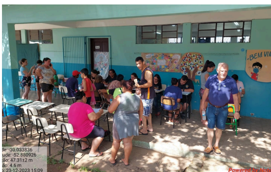
Secretaria de Assistência Social - entrega de Ajuda Humanitária