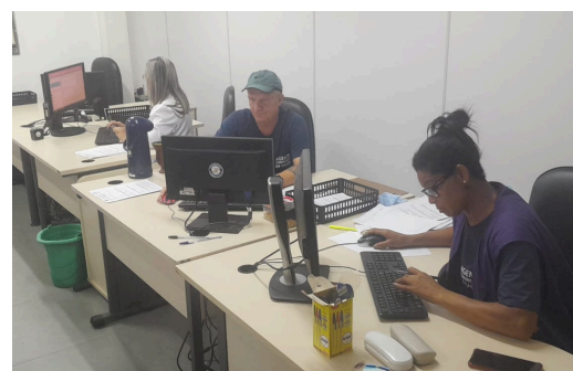
Secretaria de Saúde cadastro e atendimento de vítimas