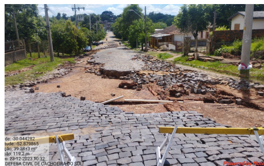
Enxurrada interrupção de vias