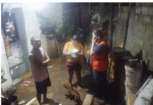
Atendimento residências afetadas por vendaval