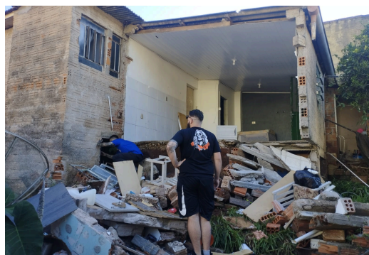
Colapso de Edificação