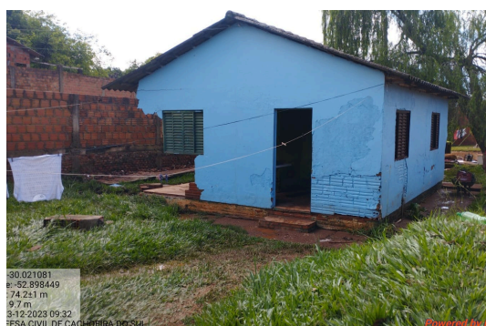
Enxurradas destruição de residências