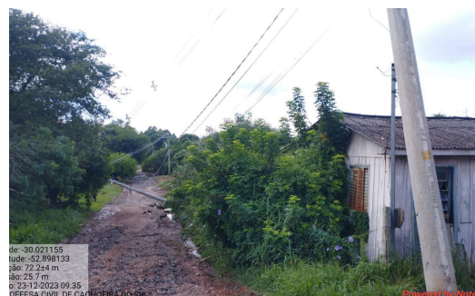
Enxurrada danos na rede elétrica