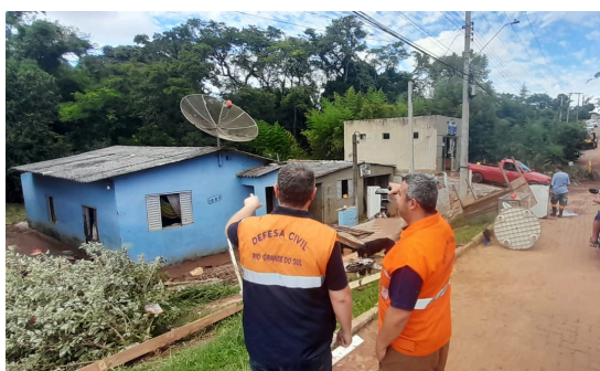
Defesa Civil RS avaliação de danos