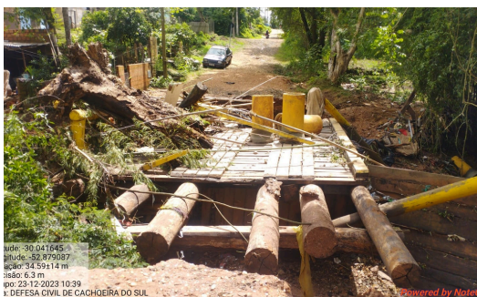
Enxurradas queda de pontes