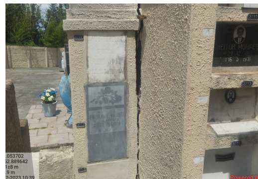
Interdição Cemitério Municipal